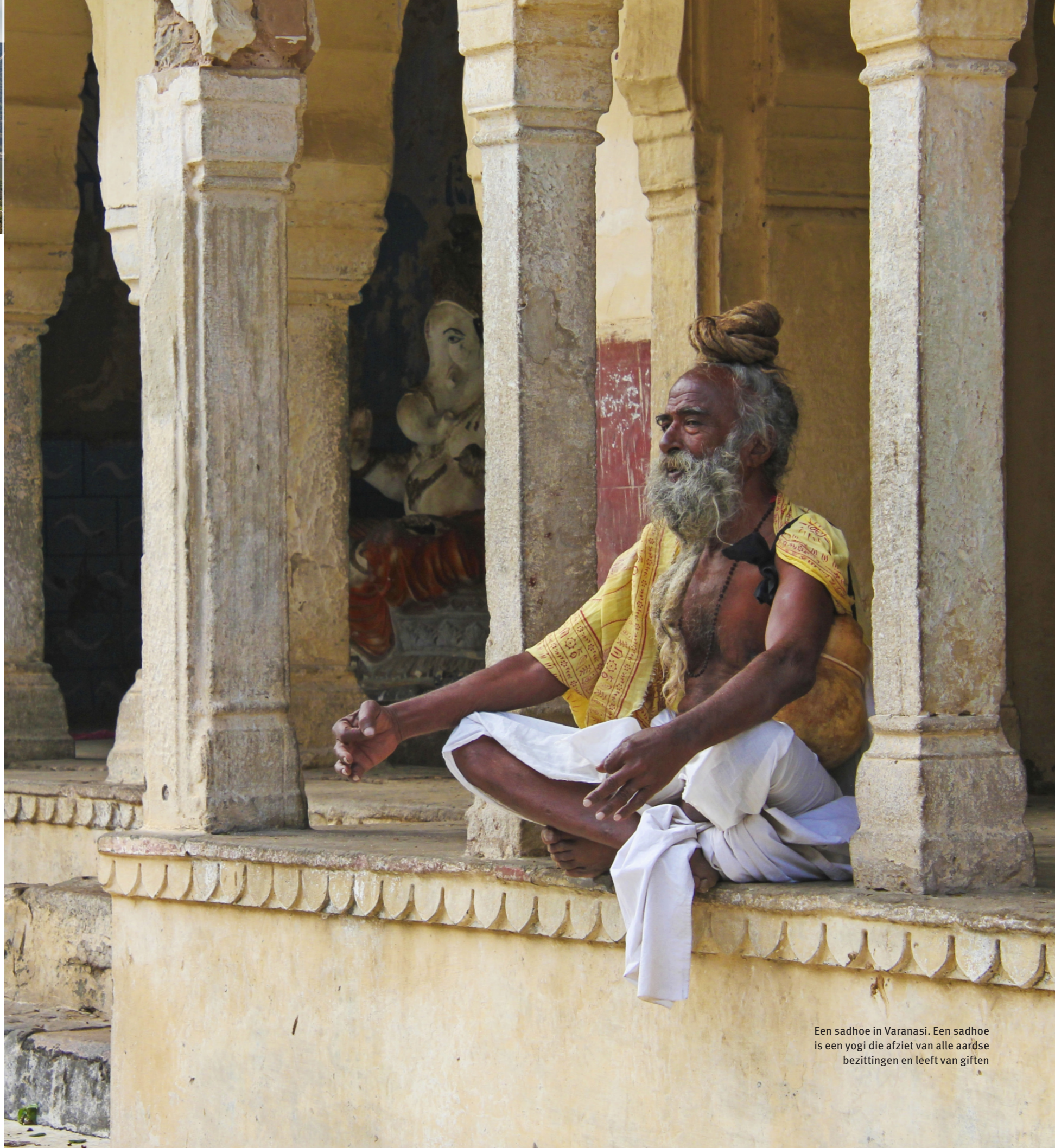
Een sadhoe in Varanasi. Een sadhoe is een yogi die afziet van alle aardse bezittingen en leeft van giften