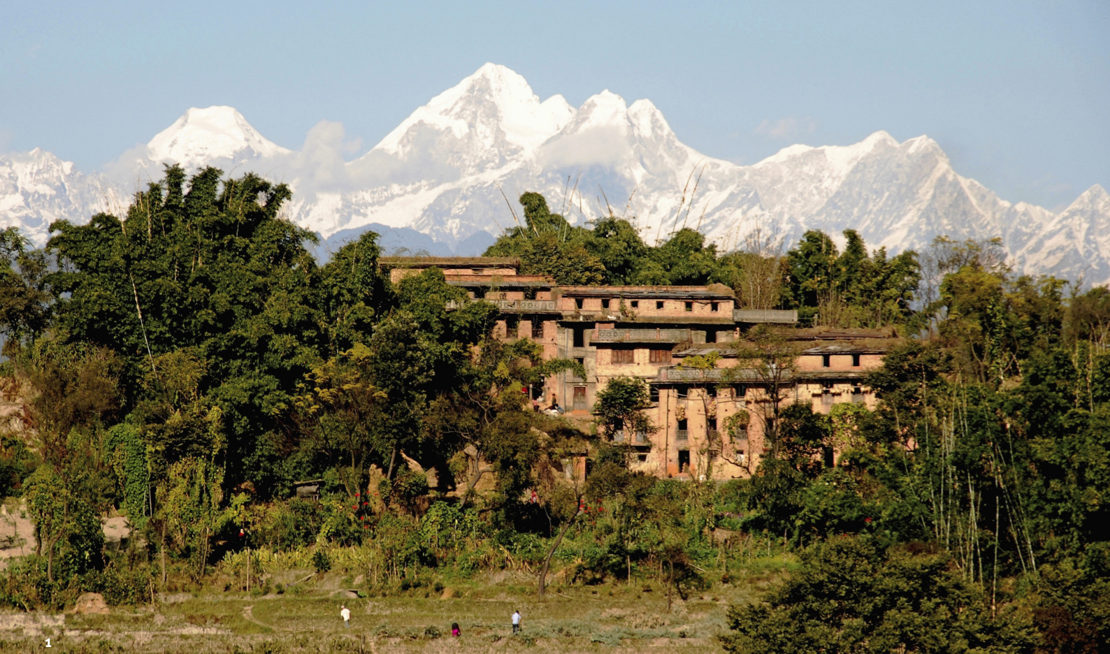
1. En dan zijn we in Nepal en zien we de Himalaya. Prachtig! 2. Een stupa in Kathmandu met de bekende, vrolijke gebedsvlaggetjes 3. Een onderonsje in Bhaktapur 4. In Kathmandu delen hindoeïsten en boeddhisten deze heilige plek en bidden er samen 5. Het meer van Pokhara