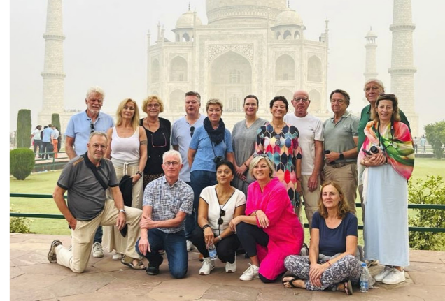
Met groepsgenoten voor de Taj Mahal