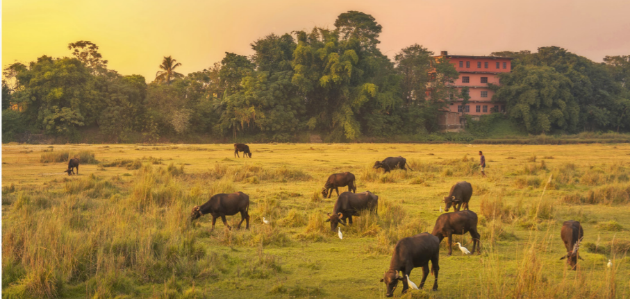
Na een 'blessing' bij tempelbezoek | In het Nationale Park van Chitwan zie je ook tijgers als je vroeg genoeg op pad gaat